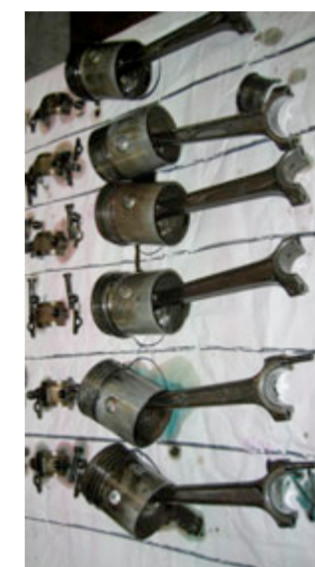
Die «grosse Zerlegung» brachte es an den Tag: Es mussten neue Kolben gegossen werden.