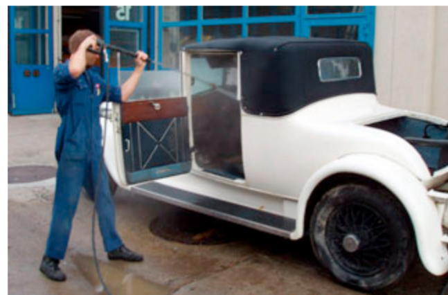
Auweia, und das einem Rolls-Royce! Aber im Vergleich zum «Schlammbad» waren das für den «Doktor» Streicheleinheiten.

Mit den Restaurationsarbeiten beauftragt wurde von der Basler Versicherung der Carrosseriebetrieb Wenger in Basel (vgl. Randspalte). Die Wahl fiel auf das Traditionsunternehmen vor allem deshalb, weil Be-