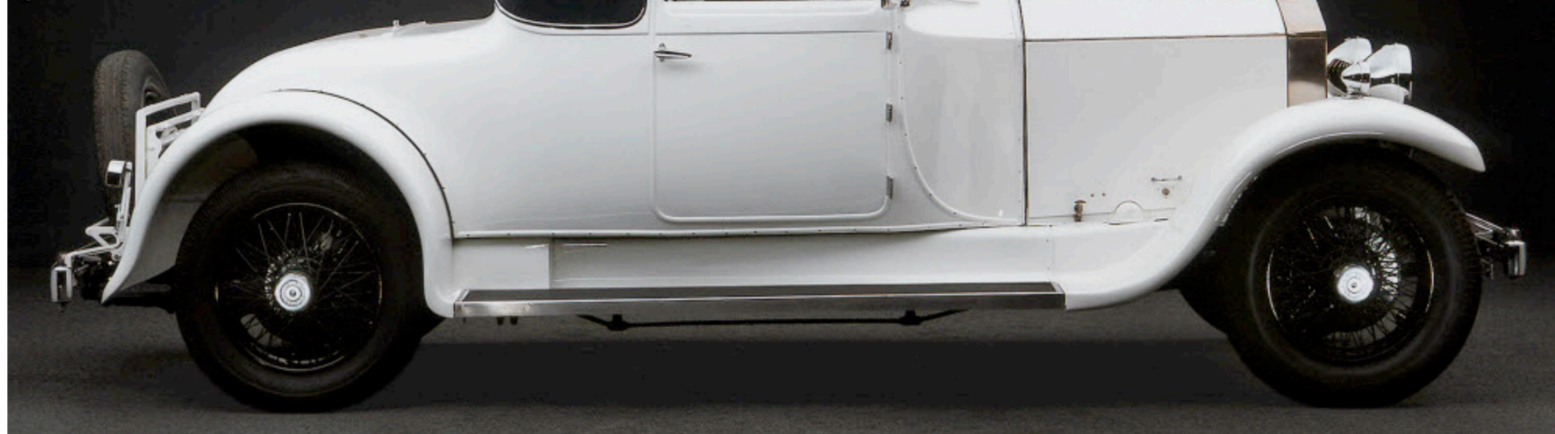
Das einst schwer unwetterschädigte Rolls-Royce-Doktor-Cabriolet sieht nach zwei Jahren wieder aus wie neu.