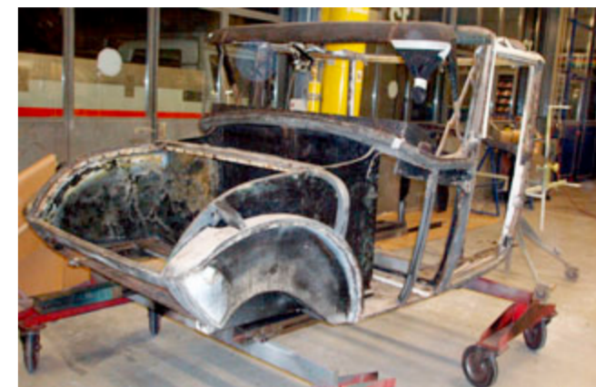
Die Holzkonstruktion der Kabine mit Schwiemutterstütz-Abteil musste während mehrerer Wochen natürlich trocknen können ...