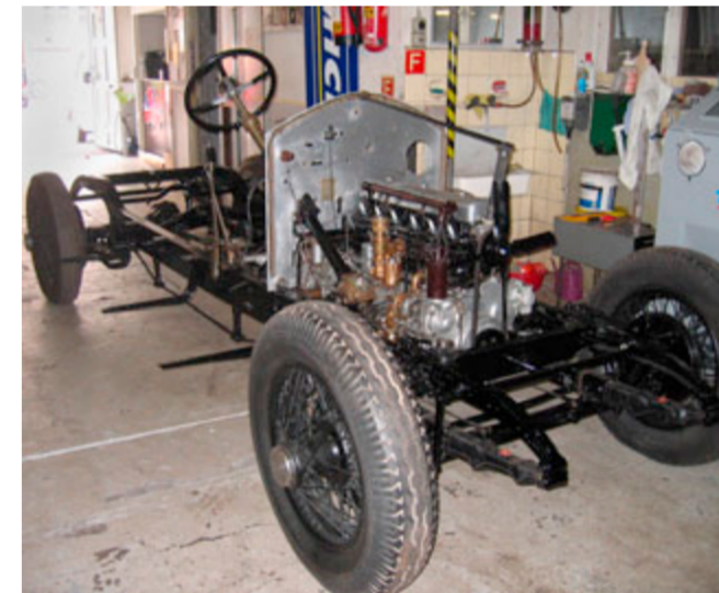
Auf diesem frisch lackierten Chassis lässt sich was aufbauen!