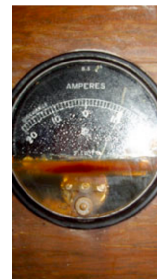
Der Pegelstand des Hochwassers liess sich im Amperemeter ablesen.