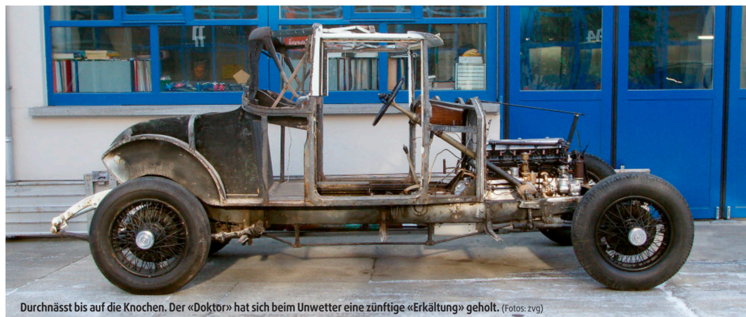
Durchnässt bis auf die Knochen. Der «Doktor» hat sich beim Unwetter eine zünftige «Erkältung» geholt.