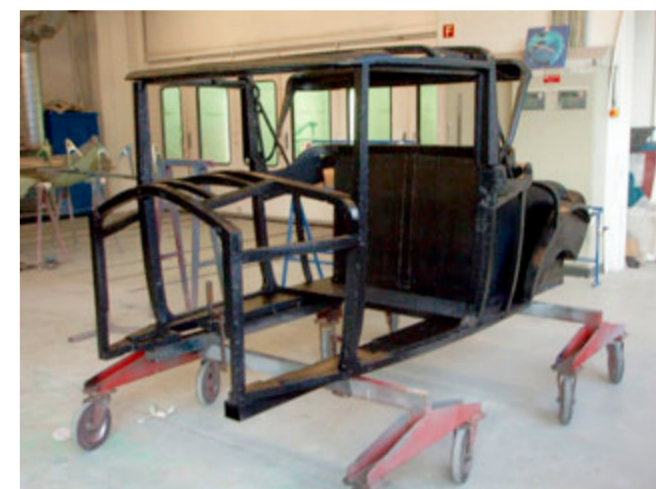
... und erhielt anschliessend eine neue Imprägnierung.